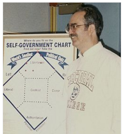
David Nolan en 1996 con una versión del Gráfico de Nolan distribuido por Defensores del autogobierno .

Nolan se dio cuenta de que, dado que la mayoría de la actividad y del control gubernamental ocurre en estas dos categorías, se puede definir la posición política de una persona o de un partido político según cuánto control gubernamental en estas dos áreas defienda. De este modo, las ideologías políticas pueden describirse como: