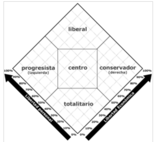
Gráfico de Nolan . Las dos dimensiones muestran la ubicación de las ideologías con respecto a la libertad individual y a la libertad económica , bajo el supuesto de que no colisionan entre sí y pueden crecer simultáneamente en el liberalismo, y además colocan el espectro político tradicional izquierda-derecha en una diagonal del gráfico.

El Gráfico de Nolan sitúa en el eje X la posición política respecto de la libertad económica y en el eje Y la posición política con respecto a la libertad personal. Fue creado en 1971, con dos ejes (económico y político) perpendiculares entre sí. A menudo se muestra el gráfico rotado 45 grados, como en el caso de El cuestionario político más pequeño del mundo . Este gráfico muestra la «libertad económica» (materias fiscales, comerciales y de libre empresa) en su eje X y la «libertad personal» (legalización de drogas, aborto, servicio militar) en el eje Y. Esto sitúa a los izquierdistas o progresistas en el cuadrante izquierdo, a los liberales arriba, a los derechistas o conservadores a la derecha y a los estatistas o populistas abajo. No obstante, no considera los conflictos entre la libertad personal y la económica que surgen, por ejemplo, entre los intereses corporativos y los de la ciudadanía.